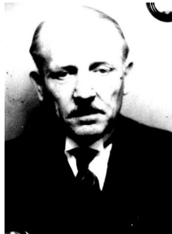
Hugo Dingler (Abbildung aus dem Ausweis der Reichsschrifttumskammer )

Hugo Dingler war zentral Mathematiker, Physiker und Philosoph, mischte sich aber auch in viele Debatten außerhalb dieser Fächer ein, obwohl er dafür nicht unbedingt als kompetent erscheinen konnte, z.B in den Ura-Linda-Streit 1 .